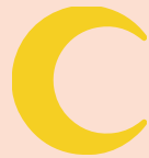
un croissant a crescent