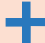
une croix a cross