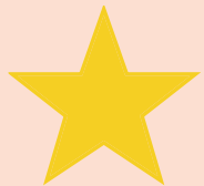
une étoile a star